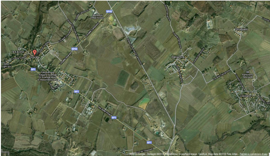
Area estrattiva - Quarata